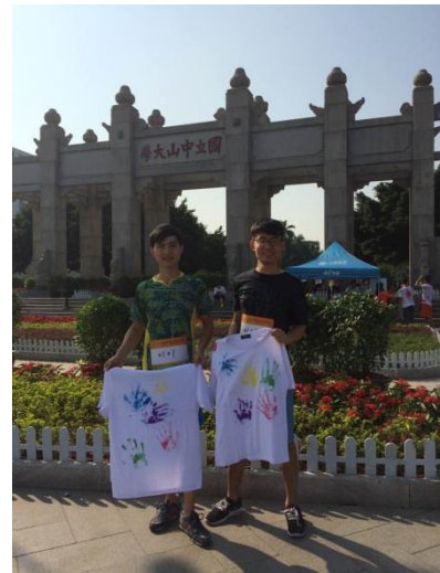
學校辦的路跑大賽

廣州是一個非常進步的地方，是中國的一線城市(北上廣，北京上海廣州)，地鐵及公車都非常發達(地鐵有近 20 條線，超複雜，一開始快崩潰)，是中國的商業重點城市，所以第一印象是非常繁華熱鬧的，而且非常熱。