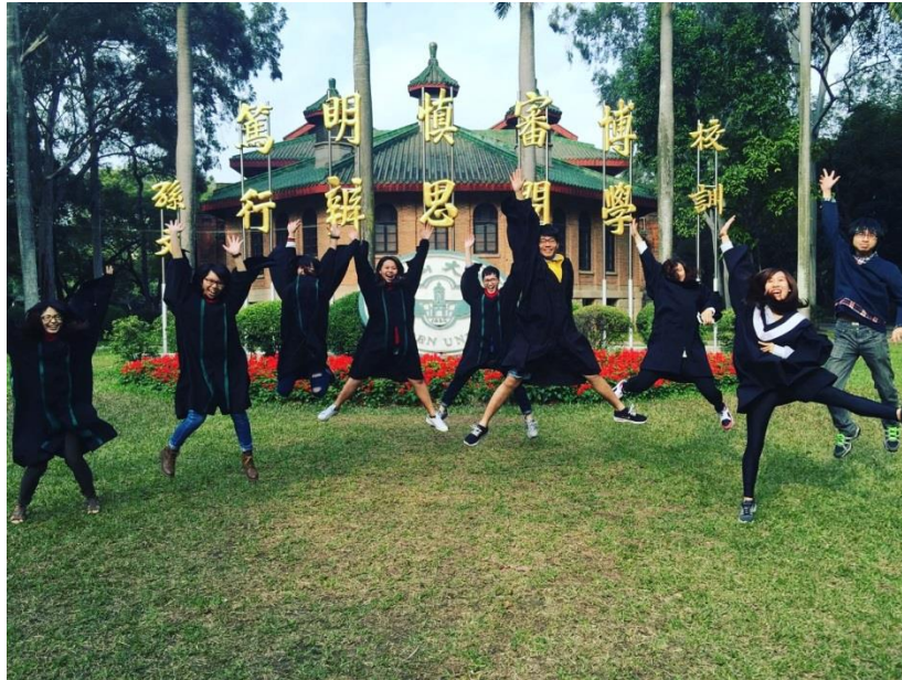
2015. 9-2016. 1 廣州中山大學

總結，交換生活是一個非常特別的經驗，不管去哪裡生活、學習，只要踏出那一步，你的視野就會不一樣！會學會很多不同層面的東西與經驗，鼓勵大家去做交換學生，broaden your horizons!