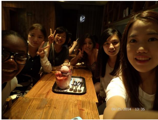
我的 buddy 和組員們'