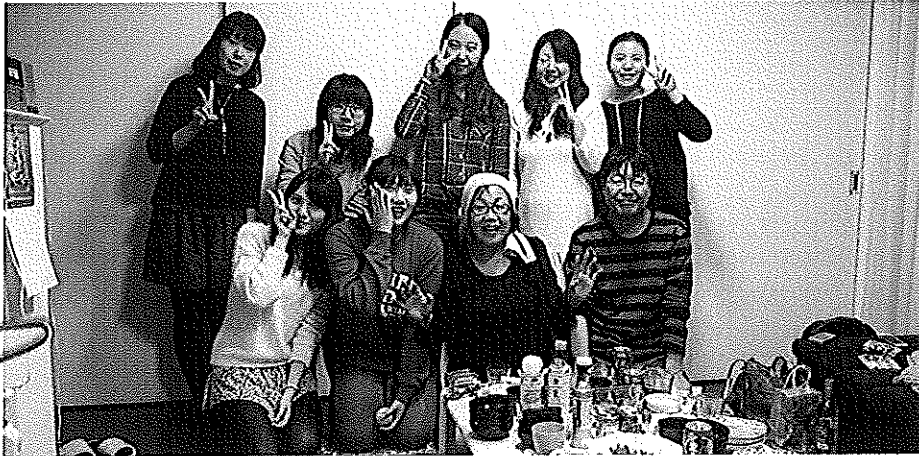
和韓國朋友一起拜訪日本友人