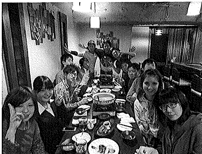
大山ゼミの同學們

Tutor是由北海道大学的日本學生擔任，可以解答妳日本生活所遇到的困難，並且練習日文會話，對於初來乍到的留學生來說是相當貼心的制度。