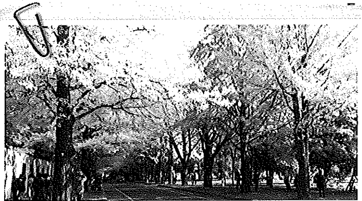
北海道大學 留學生中心近處 秋景