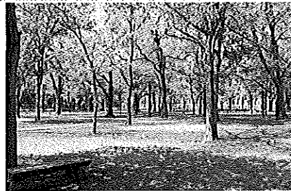
北海道大學經濟學部近處 夏景