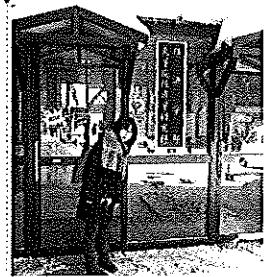
北海道大學經濟學部